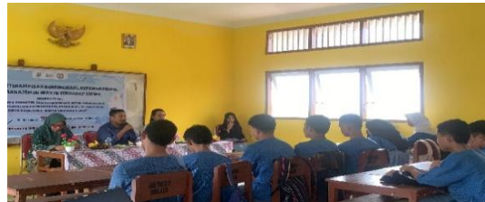
Gambar 2. Sambutan oleh dosen pengampu

Dalam upaya meningkatkan pemahaman konsep keterampilan komunikasi, kepemimpinan, dan manajemen waktu. Penyampaian materi dan diskusi panel disampaikan oleh mahasiswa program studi manajemen Pendidikan Islam FITK UIN AM Sangadji Ambon, diharapkan memberikan pemahaman tentang pentingnya komunikasi efektif dalam organisasi, kemampuan mengambil keputusan sebagai pemimpin di dalam kelompok, serta teknik dasar manajemen waktu yang baik dalam kehidupan sehari-hari. Dalam kaitannya dengan penyampaian tersebut, relevan dengan yang dikemukakan oleh (Ana & Agus, 2020) bahwa pemenuhan dalam aspek manajemen waktu di antaranya penting untuk menetapkan tujuan, menyusun prioritas, bersikap tegas dan menghindari penundaan.