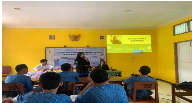
Gambar 3. Penyampaian Materi dari Mahasiswa MPI kepada Siswa SMA ALHilaal Ambon

Dalam kegiatan pelatihan yang dilaksanakan, terdapat beberapa manfaat di antaranya 1) manfaat kegiatan untuk program studi dapat menjalin kerja sama antara program studi dengan sekolah, serta dapat meningkatkan mutu program studi serta membuat program studi banyak dikenal oleh masyarakat secara luas. Kemudian 2) Manfaat kegiatan untuk sekolah dan peserta didik, yaitu sekolah bisa membangun citra dan reputasi yang baik dengan menjalankan program inovatif dengan adanya kegiatan pelatihan ini yang memberikan manfaat, sehingga kepercayaan masyarakat terhadap sekolah semakin meningkat. Dan 3) siswa yang mengikuti kegiatan pelatihan lebih mudah berkomunikasi dengan orang lain, bekerja sama dalam tim, memimpin dengan baik, mengatur waktu lebih efektif, serta menemukan solusi yang lebih kreatif untuk masalah yang dihadapi.